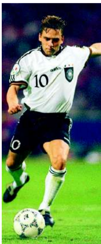
Thomas „Icke“ Hässler 1996 im National-Dress

Vor dem Spiel ist ab 16 Uhr Schautraining für acht bis zwölfjährige Jungen und Mädchen. Abends fahren Busse vom Platz nach Seelscheid und Neunkirchen. Dass das FC-Publikum früher kritischer war, erzählten die Kicker, die in den 60er und 70er Jahren bei Köln spielten: „Wenn wir verloren hatten, mussten wir befürchten, dass beim nächsten Mal sofort 15 000 Zuschauer weniger im Stadion sein würden“, erinnert sich Wolfgang Weber.